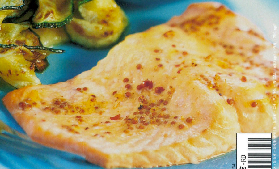
Pavés de truite à la crème de moutarde